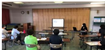
中部会場（琴浦町保健センター）