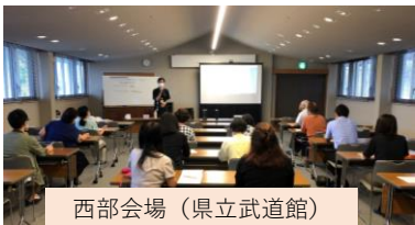
西部会場（県立武道館）